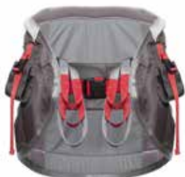
ThoraxSling, Con soporte sentado

Juntos, MiniLift y ThoraxSling ofrecen un apoyo a la bipedestación muy suave y agradable. El movimiento del brazo de la grúa está diseñado de manera que el movimiento de tracción se ejerce cómodamente en la columna lumbar, lo que evita que el arnés se suba hasta las axilas.